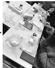
デコレーションに挑戦中