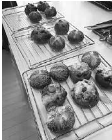
焼き上がった2種類のパン