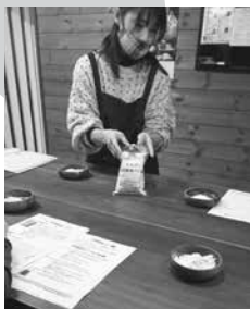
ホシノ酵母の説明