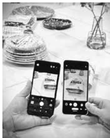
カメラの特徴を押さえる