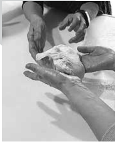
グルテンが確認できます