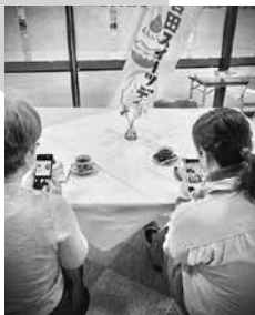
写真の加工に挑戦