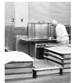
どら焼きを焼く職人さん