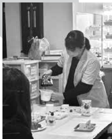
生クリームのお菓子をのっけます